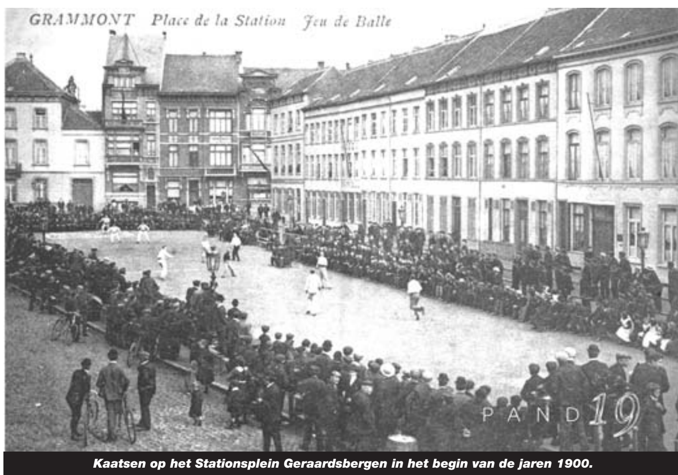
Kaatsen op het Stationsplein Geraardsbergen in het begin van de jaren 1900.